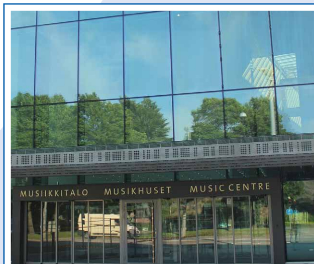
AV & BROADCAST